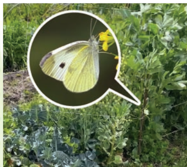
菜の花に来たモンシロチョウ