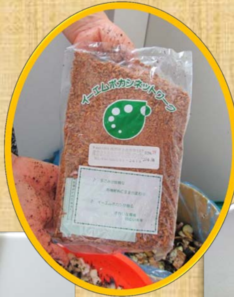
EM菌を混ぜ合わせます