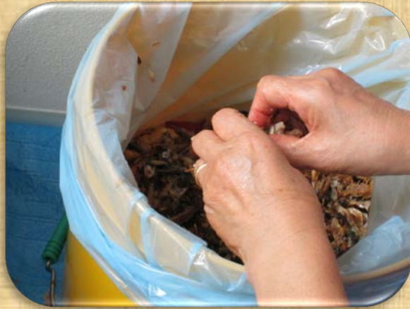
生ゴミを細かく碎きます