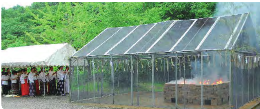
生長の家総本山での六月晦大祓式の模様