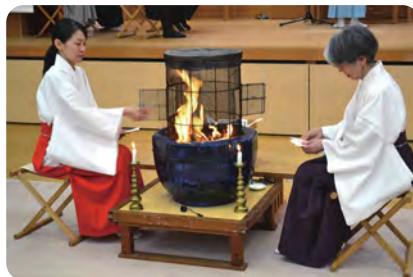
千葉県教化部における 六月晦大祓式の模様