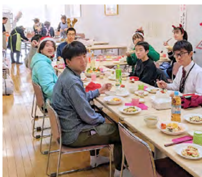
「仲間たちとの楽しいひととき」