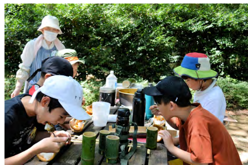
「野外での昼食はおいしい！」