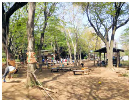
「自然の中でいっぱい遊ぼう！！」