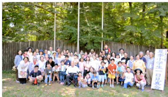
「令和5年度夏季小学生一日見真会」