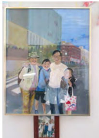
孫たちと記念 撮影