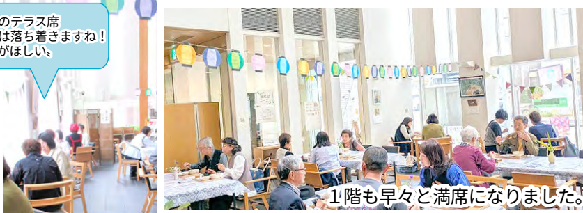
1階も早々と満席になりました。