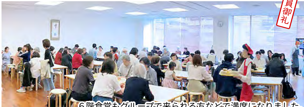
6階食堂もグループで来られる方などで満席になりました。